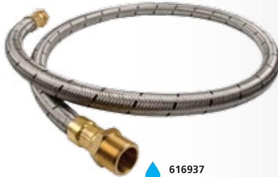
616937 Agua fría