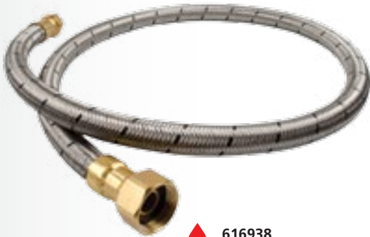
616938 Agua caliente